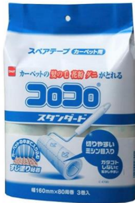
コロコロリフィル